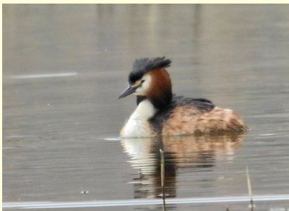
张黎明 摄（作者单位：省交通工会）