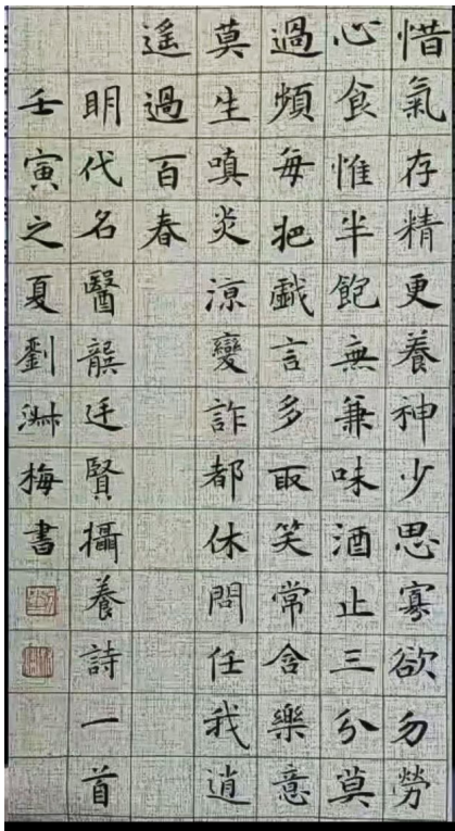
书法 刘淑梅(作者单位:甘肃路桥建设集团)