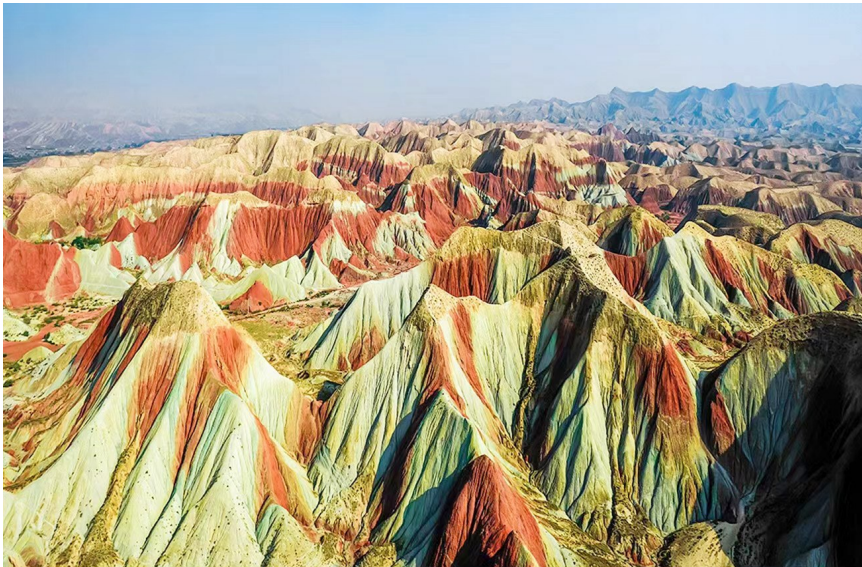
航拍兰州苦水丹霞