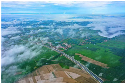
科学顶层设计推动高质量发展

2023年是全面贯彻党的二十大精神开局之年,全省交通运输系统深入开展主题教育,扎实开展“三抓三促”行动,全省交通运输经济持续稳定恢复,行业客货运输主要指标保持较快增长,各项工作稳步提升,为全省经济高开稳走、持续向好提供了坚实有力的交通运输服务保障。