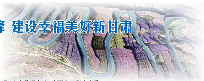
蹄疾步稳推进交通强国建设